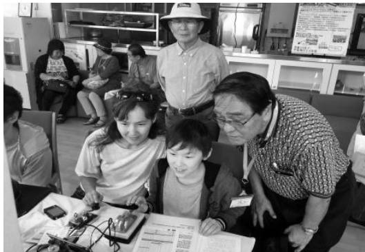
2019年11月23日(土)国頭郡恩納村にある沖縄電磁波